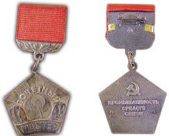
«Почетный мастер промышленности средств связи СССР», знак Министерства промышленности средств связи. Выдавался с 1974 по 1989 год

В начале 2000-х годов оба звания и значки к ним были восстановлены и на сегодняшний день являются действующими ведомственными знаками отличия. Сегодня звание «Мастер связи» присваивается высокопрофессиональным работникам сферы информационных технологий и связи за успехи в совершенствовании инфокоммуникационного комплекса страны, в реализации федеральных и региональных программ развития связи и информатизации, работающим в указанной области 15 лет и более. Награждение нагрудным значком «Почетный радист» производится в отношении работников Мининформсвязи России, Минобороны России, Минкультуры России, Минпромэнерго России, ФСО России, подведомственных им федеральных служб и федеральных агентств, а также соответствующих предприятий, учреждений и организаций — приказами этих федеральных органов исполнительной власти; в отноше-