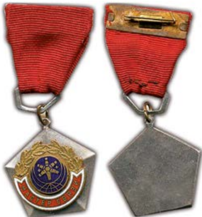
Почетный знак «Мастер связи СССР». Как и все знаки к почетным званиям, носится на правой стороне груди; размещают их ниже орденов и медалей, а при отсутствии орденов и медалей — на их месте

Есть ордена и медали, которые знают все. Это часть нашей истории. Они пользуются заслуженным уважением у граждан, а награжденные ими лица — соответствующими льготами. Но есть награды, истинный смысл которых понятен немногим. Это можно сказать, например, о значке «Почетный радист СССР» и о почетном знаке «Мастер связи». Даже в таком крупном объединении, каким было в 70–80-е годы прошлого века ЦНПО «КАСКАД», счет работников, получивших эти награды, шел всего лишь на десятки. Так, в юбилейном для предприятия 1979 году (год 60-летия Объединения) 442 работника были награждены значком «Ветеран труда Объединения» и только 10 человек — значком «Почетный радист СССР».