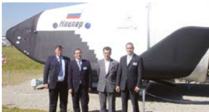
Руководство ПАО ЦНПО «КАСКАД» на стенде РКК «Энергия», МАКС, 2005 год

ма. На 2017 год запланировано строительство второй очереди «Восточного». Ранее строительством космодрома занималось Федеральное агентство по специальному строительству (Спецстрой), однако оно было упразднено. Отмечалось, что поводом для ликвидации стали многочисленные претензии заказчиков и органов власти к срокам исполнения работ и финансовой дисциплине подведомственных агентству ФГУП. ЦЭНКИ — одно из основополагающих предприятий аэрокосмической отрасли. Предприятие специализируется на создании наземной космической инфраструктуры и эксплуатации космодромов «Байконур», «Восточный». Источник: http://tass.ru/kosmos/3943605 .