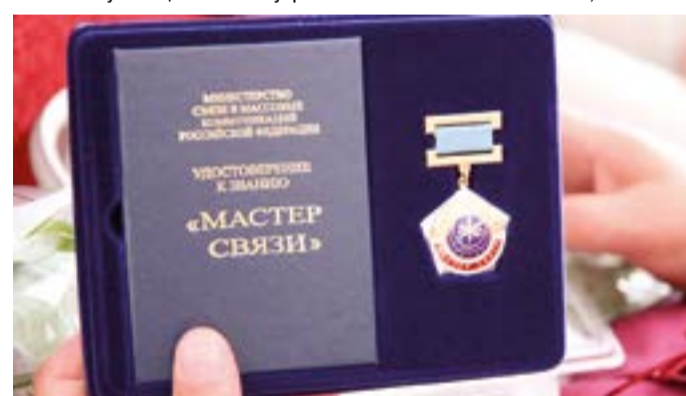
Современный знак «Мастер связи России». Утвержден в 2004 году в соответствии с постановлением Правительства РФ № 578

Знак «Почетный радист» имеет форму ромба, с внешней стороны покрытого синей эмалью. Бо-