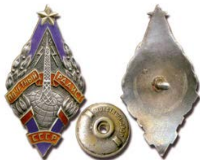
Один из ранних значков «Почетный радист СССР» на винте. В 1980-е годы винт заменили булавкой

По стечению обстоятельств «Почетный радист СССР» оказался первым в Советском Союзе послевоенным государственным наградным знаком. Как упомянуто в удостоверении к знаку, он был учрежден специальным постановлением СНК СССР от 2 мая 1945 г. № 939 (статут был разработан позже). Это постановление объявляло 7 мая (по старому стилю — 25 апреля; день памятного выступления А. С. Попова на заседании Русского физико-химического общества) новым праздником: День радио устанавливался как день пропаганды радио и радиолюбительства в СССР. Пункт 5 постановления уведомлял об учреждении знака «Почетный радист» для награждения лиц, способствовавших развитию радио своими достижениями в области