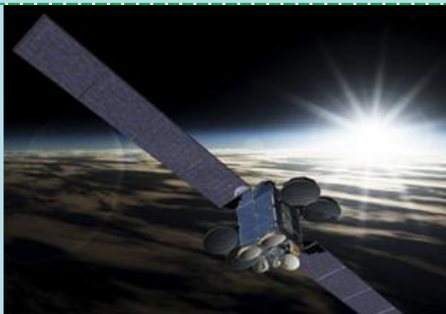
ST 2 [MELCO]

Другой спутник, GSAT-8, принадлежит Индийской организации космических исследований и рассчитан на передачу прямого спутникового теле- и радиосигнала.