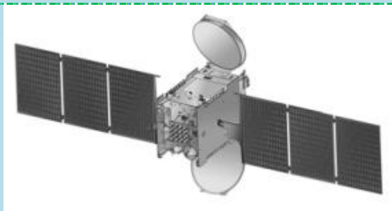
GSat 8 [ISRO]