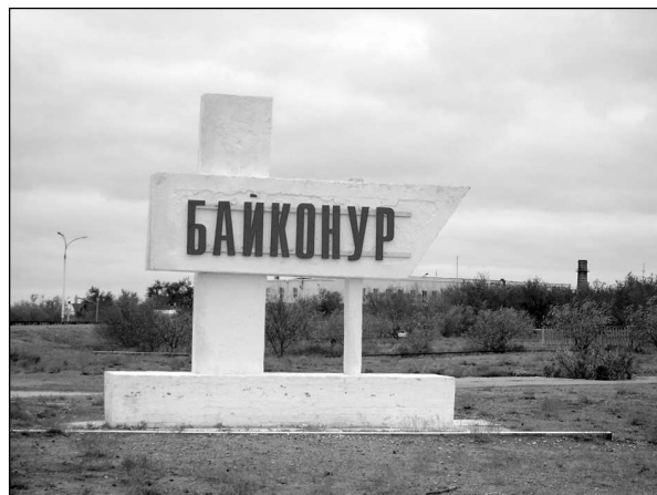
Рис. 2. Космодром «Байконур»

Неясен был и статус космодрома. Лишь в 1994 году между Россией и Казахстаном был