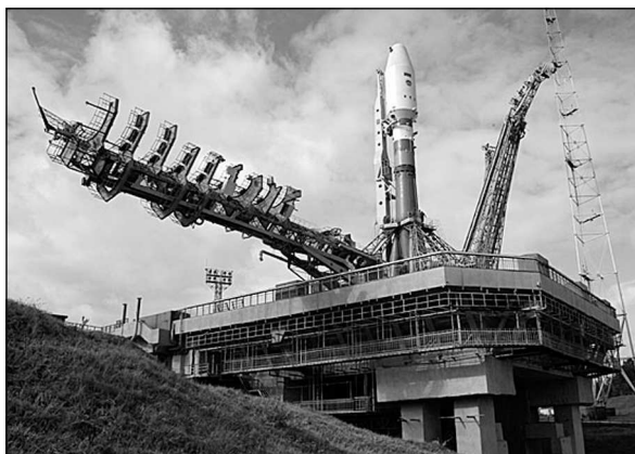
Рис. 4. Космодром «Плесецк». Площадка №43

Решение о строительстве ракетной базы для запуска межконтинентальных баллистических ракет Р-7 и Р-7А (объект «Ангара») было принято Советом Министров СССР 11 января 1957 года. Формирование соединения начато