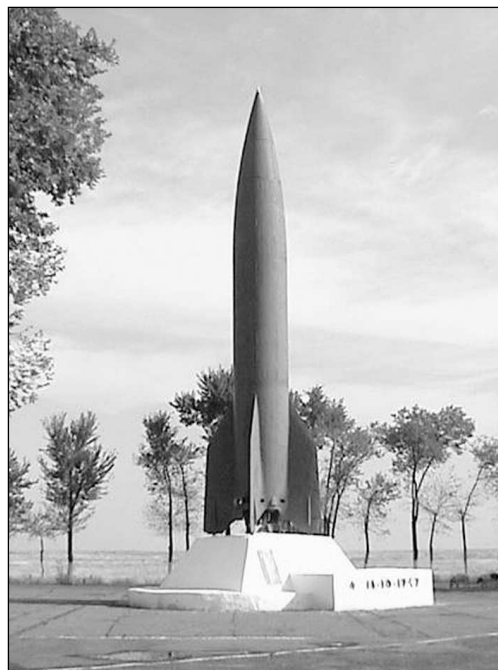
Рис. 5. Полигон «Капустин Яр». Обелиск в честь запуска первой отечественной баллистической ракеты

Строительство жилья на полигоне не велось вплоть до 1948 года, строители и испытатели