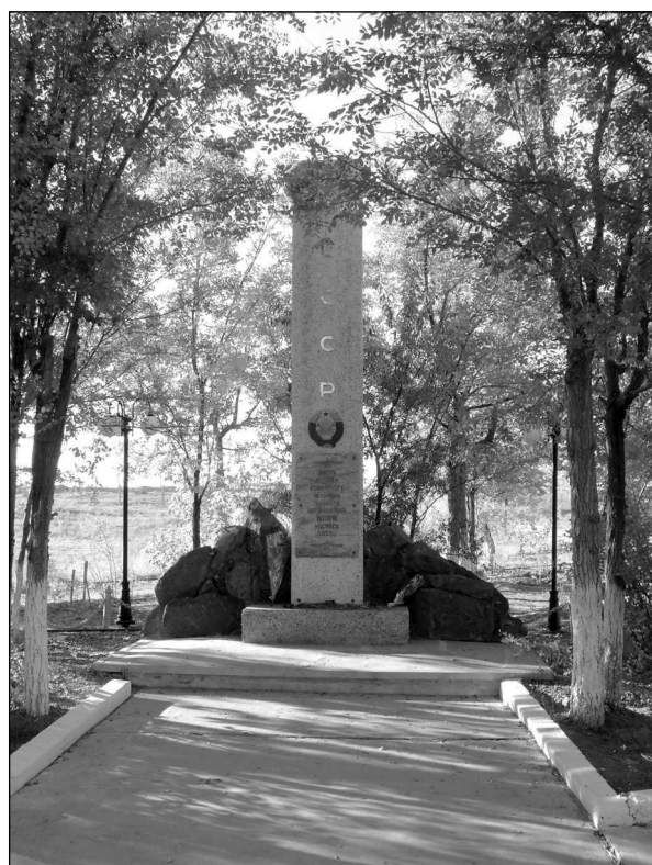
Рис. 3. Байконур. «Гагаринский старт». Обелиск в честь запуска первого в мире искусственного спутника Земли

подписан договор о передаче космодрома «Байконур» в аренду России на 10 лет. В 2004 году срок аренды был продлен до 2050 года. Стоимость аренды составляет около 3,5 млрд рублей в год. Еще около 1,5 млрд рублей в год Россия тратит на поддержание объектов космодрома. Кроме того, из федерального бюджета России