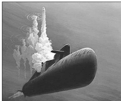
Рис. 6. Космический старт с подводной лодки

Кроме того, местные власти за счет создания космодрома намерены решить региональные задачи в Дальневосточном федеральном округе. В частности, улучшить демографическую ситу-