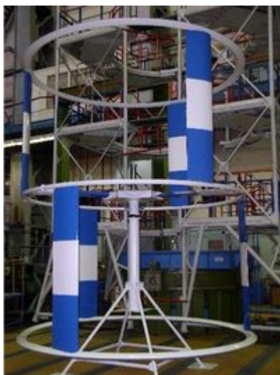
Установка мощностью 3кВт (6-ти лопастной вариант)

24.03.2010 В ОАО «ГРЦ Макеева» побывала съемочная группа федерального телеканала – ГТРК «Россия».