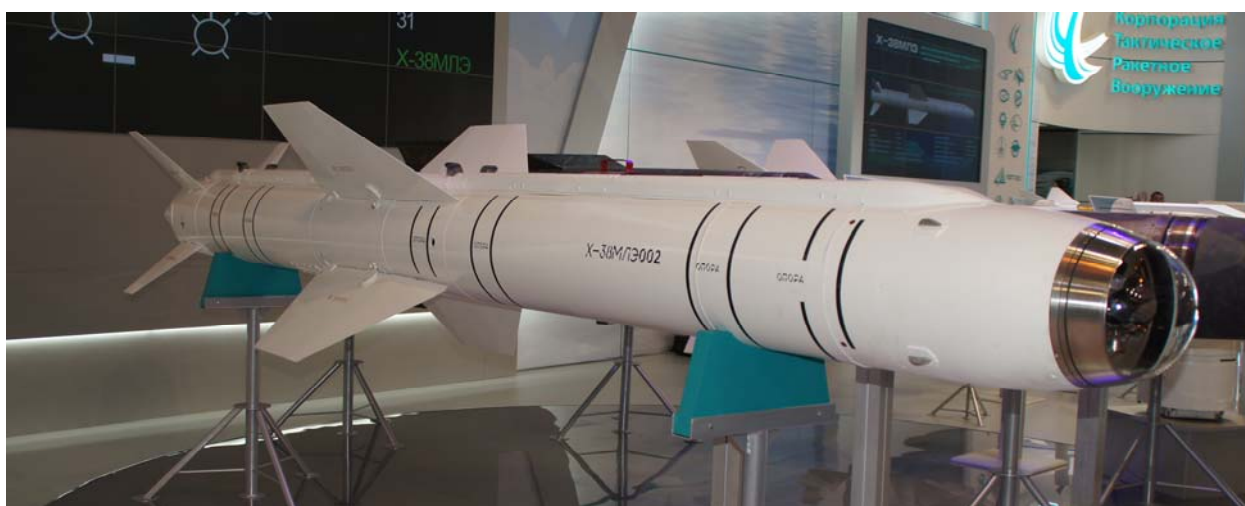
Модульная ракета класса "воздух - поверхность" X-38МЛЭ