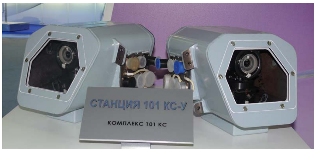
Станция «101 КС-У»

многофункциональную оптико-электронную интегрированную систему для самолета нового поколения. Система представляет собой целый комплекс, в задачи которого входит полный контроль обстановки во всех оптических диапазонах вокруг самолета. В состав нового оптико-электронного комплекса «101 КС» входят станции 101 КС-У, 101 КС-В, 101 КС-О и другая аппаратура.