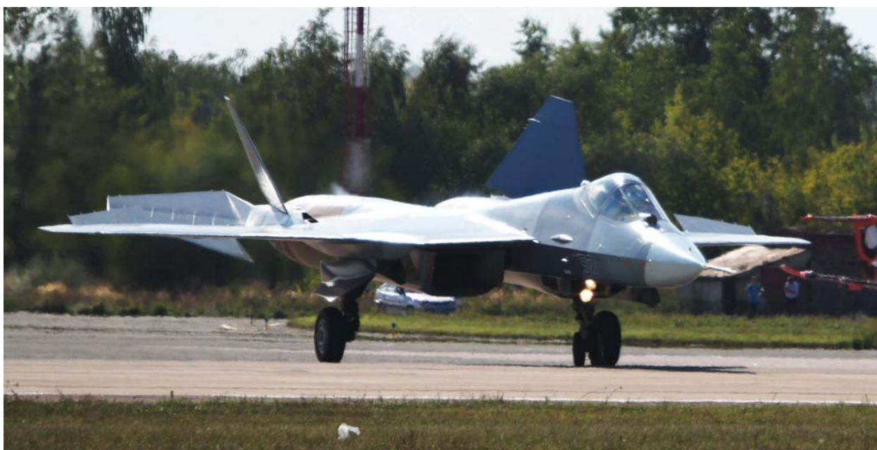
Истребитель Т-50 перед полетом

В конце 2010 года Россия подписала с Индией контракт на совместную разработку истребителя пятого поколения FGFA, который будет создан на базе Т-50. FGFA встанет на вооружение ВВС Индии. Кроме того, обе стороны намерены поставлять истребитель на экспорт.