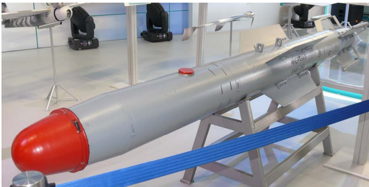
250-килограммовая корректируемая авиационная бомба

Головное предприятие ОАО «Корпорация "Тактическое ракетное вооружение"» сегодня предлагает модульный ряд ударных ракет Х-38МАЭ; Х-38МКЭ; Х-38МЛЭ и Х-38МТЭ, противокорабельные ракеты Х-35УЭ и Х-31АД, противорадиолокационную УР Х-31ПД. Предприятие корпорации «ГосМКБ «Радуга» на МАКС-2011 продемонстрировало комплекс ракетного оружия «Овод-МЭ» с УР Х-59М2Э и Х-59МК2, противорадиолокационную ракету Х-58УШКЭ, ГНПП «Регион – новую 250-килограммовую корректируемую авиационную бомбу.