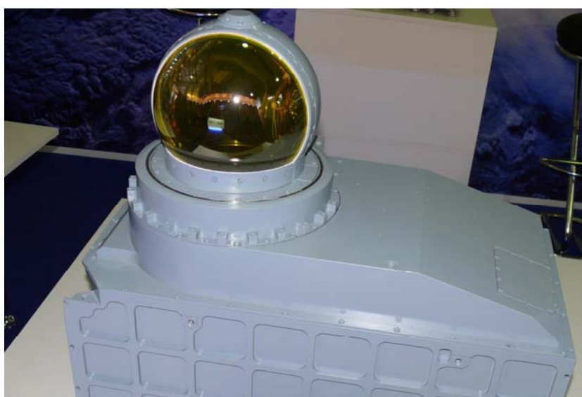
Станция «101 КС-В»