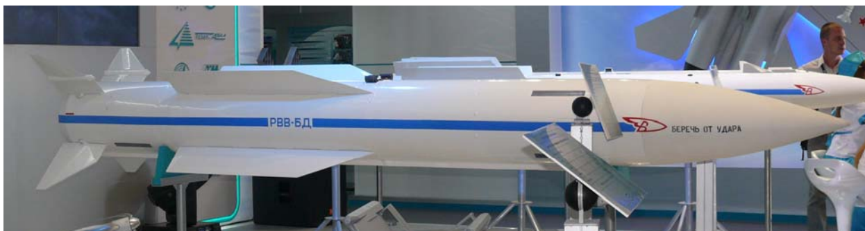
Новая ракета класса "воздух - воздух" РВВ-БД

ракет, а с 2012 года начнется их серийное производство. По сравнению с УР большой дальности Р-33Э новая ракета имеет значительно улучшенные характеристики.