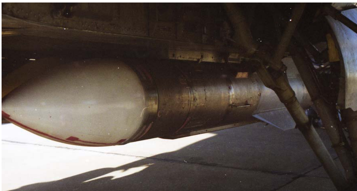
Авиационная ракета большой дальности класса «воздух-воздух» на МАКС-2001

Как сообщили в пресс-службе Корпорации «Тактическое ракетное вооружение», высокие аэродинамические свойства ракеты РВВ-БД и использование двухрежимного твердотопливного ракетного двигателя при стартовой массе до 510 кг, позволяют обеспечить дальность пуска до 200 км (у Р-33Э – 120 км) на высотах от 15 м до 25 км. Ранее похожая ракета была показана на салоне МАКС-2001, она была подвешена под самолетом МиГ-31М. Однако из-за снижения финансирования оборонного заказа комплекс перехвата с МиГ-31М в серию не пошел.