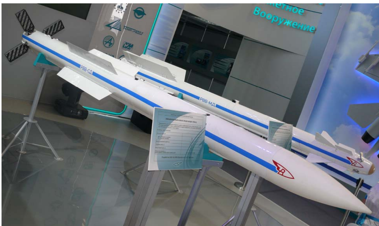
Ракеты класса "воздух - воздух" РВВ-МД и РВВ-СД

Общая линейка ракетного вооружения ПАК ФА была представлена на авиасалоне МАКС-2011 в Жуковском. Предположительно, самолет будет вооружен 30-миллиметровой пушкой, а также ракетами РВВ-МД, РВВ-СД и РВВ-БД малой, средней и большой дальности. В общей сложности, для истребителя в настоящее время разрабатывается вооружение 14 типов.