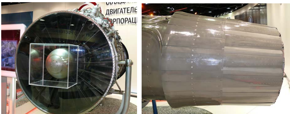
Двигатель первого этапа «Изделие 117С»

Двигатель первого этапа - АЛ-41Ф1 - АЛ-41Ф1С ("Изделие 117С") - будет использоваться на прототипах самолета и первых серийных моделях, которые начнут поступать на вооружение ВВС России в 2015 году.