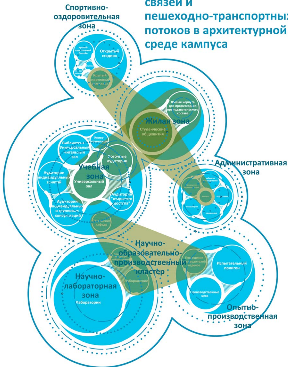
Рис. 1. Система пространственных связей и пешеходно-транспортных потоков в архитектурной среде загородных университетских кампусов.