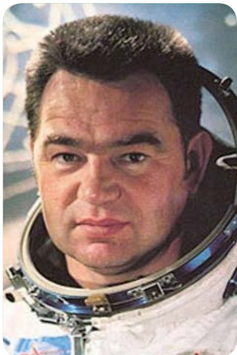
Гречко Георгий Михайлович

Космонавт СССР: №34 Космонавт мира: №75 Число полетов: 3 Продолжительность: 134 дня 20 часов 32 минут 58 секунд Число выходов в открытый космос: 1 Гречко Георгий Михайлович родился в Ленинграде 25 мая 1931 года.