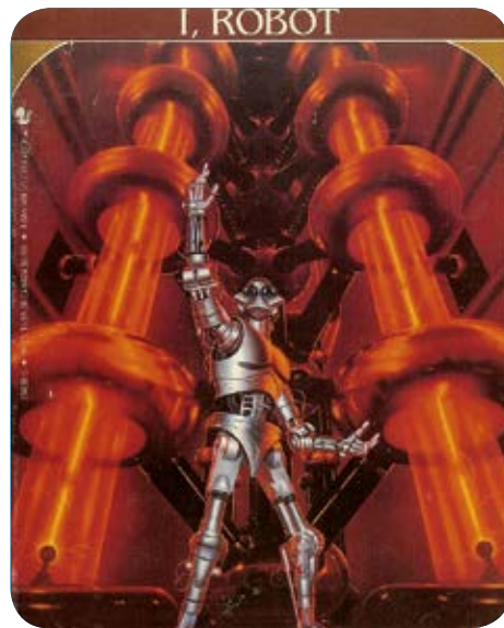
«Робот не может причинить вред человечеству или своим бездействием допустить, чтобы человечеству был причинён вред». (Айзек Азимов. «Нулевой закон робототехники», 1986 г.)

Так что не стоит недооценивать возможности человеческого воображения.