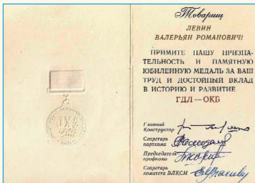
Рис. 3: Удостоверение о 40-лети ГДЛ-ОКБ (ныне: АО "НПО "Энергомаш им. акад. В.П.Глушко").