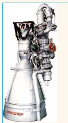
Рис. 5: ЖРД НК-33

меня - ведущего сравнительные кавитационные испытания насоса ЖРД РО-7 на холодной воде и жидком кислороде. Неожиданные по воззрениям тех лет результаты по улучшению кавитационных показателей насоса при повышении температуры жидкого кислорода были актуальны. Выпущенные летом 1967 года технические отчеты ЦИАМ послужили основой для главного конструктора Н.Д. Кузнецова (г. Куйбышев) в доказательстве Заказчику достаточности принятого кавитационного запаса кислородного насоса ЖРД для РН пилотируемого корабля лунного проекта Н1-Л1 при предельно высокой температуре жидкого кислорода.