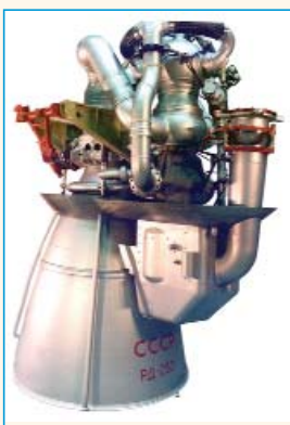
Рис. 4: ЖРД РД-253